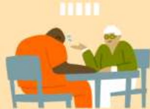
Forensic or criminal psychologist