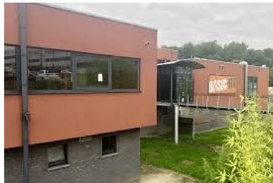
De Basic Fit club op de Brussels Health Campus te Jette, opgestart anno 2001 (als Sportopolis)

afdelingshoofd. Indien dit item dan niet direct opgelost kan worden, is dit aanleiding tot het organiseren van een vergadering van het overlegplatform. Het overlegplatform heeft dus geen vast vergaderstramien, maar wordt samengeroepen indien er via één van de partners een agendapunt wordt aangebracht.